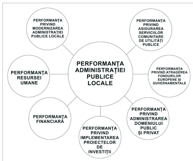
Figura 1: Componentele principale ale performanței în administrația publică locală

Modernizarea administrației publice locale trebuie să fie un obiectiv permanent al autorităților locale, scopul fiind apropierea prin mijloace moderne de cetățean, facilitarea accesului cetățeanului la informații în timpul cel mai scurt posibil, asigurarea tuturor informațiilor prin pagini web sau diverse platforme în mediul virtual. Modernizarea administrației publice presupune o interacțiune facilă prin mijloace în mediul virtual și diminuarea la maxim a timpului petrecut de cetățean la ghișeu sau la sediul instituțiilor